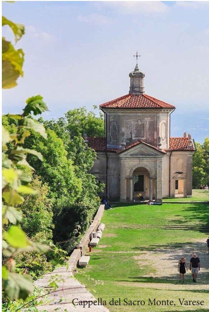
Cappella del Sacro Monte, Varese